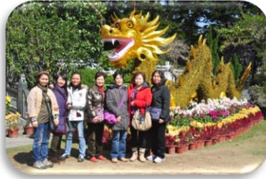
雲泉仙館新春團拜